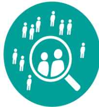
RESEARCH & ANALYSE