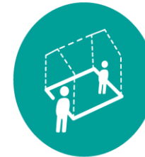
KVALIFICERING & TEST