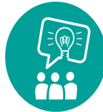
IDE & KONCEPTER