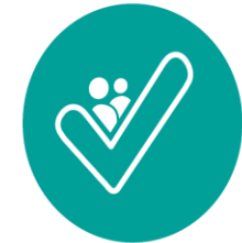
IMPLEMENTERING & EVALUERING

Projektbeskrivelse Hypoteser Innovationsspørgsmål Succeskriterier Business case