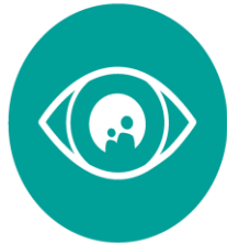
VISION & PLAN

- Evnen til at drive og facilitere en forandringsproces og inddrage brugerne mere aktivt i udviklingen af fremtidens velfærdsydelser